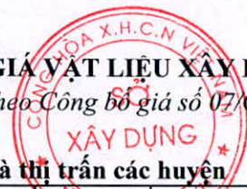
BẢNG 2. Giá tại trung tâm thành phố và thị trấn các huyện

(Kèm theo Công bố giá số 07/CBGVLXD-SXD ngày 10 tháng 7 năm 2024 của Sở Xây dựng)