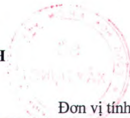
Bảng 1. CHỈ SỐ GIÁ XÂY DỰNG CÔNG TRÌNH (NĂM 2020 = 100)