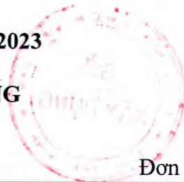
Bảng 2. CHỈ SỐ GIÁ PHẦN XÂY DỰNG (NĂM 2020 = 100)