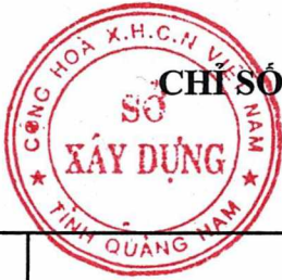
Bảng số 3 (tiếp)