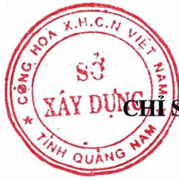
Bảng số 3