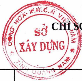
Bảng số 3 (tiếp)