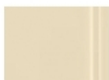
# 2 Vàng kem