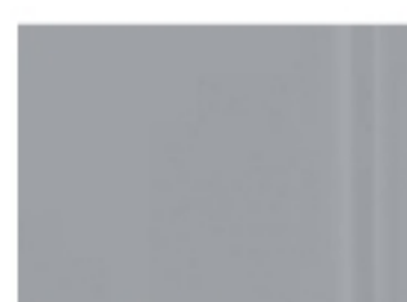
# 5 Ghi