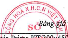
Bảng giá vật liệu xây dựng công bố tháng 4 năm 2021