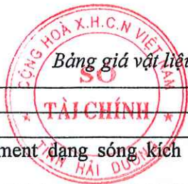
Bảng giá vật liệu xây dựng công bố tháng 4 năm 2021