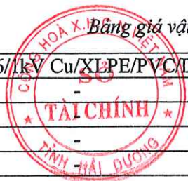
Bảng giá vật liệu xây dựng công bố tháng 4 năm 2021