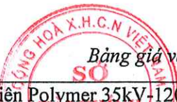
Bảng giá vật liệu xây dựng công bố tháng 4 năm 2021