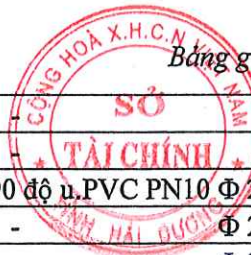
Bảng giá vật liệu xây dựng công bố tháng 4 năm 2021