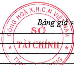
Bảng giá vật liệu xây dựng công bố tháng 4 năm 2021