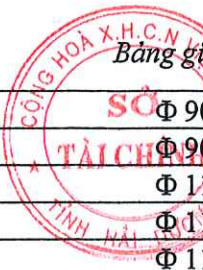
Bảng giá vật liệu xây dựng công bố tháng 4 năm 2021