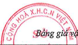
Bảng giá vật liệu xây dựng công bố tháng 4 năm 2021