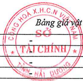
Bảng giá vật liệu xây dựng công bố tháng 4 năm 2021