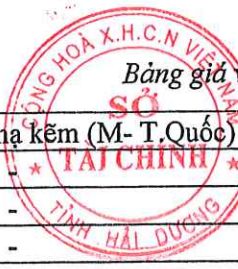
Bảng giá vật liệu xây dựng công bố tháng 4 năm 2021