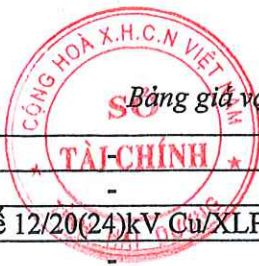
Bảng giá vật liệu xây dựng công bố tháng 4 năm 2021