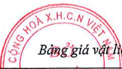
Bảng giá vật liệu xây dựng công bố tháng 4 năm 2021