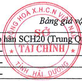
Bảng giá vật liệu xây dựng công bố tháng 4 năm 2021