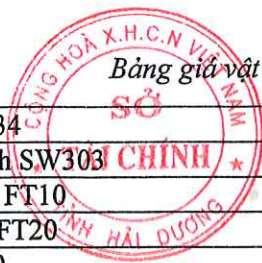
Bảng giá vật liệu xây dựng công bố tháng 4 năm 2021