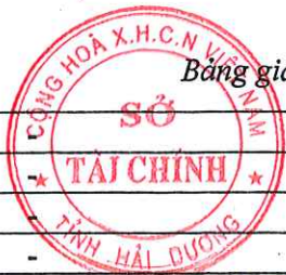
Bảng giá vật liệu xây dựng công bố tháng 4 năm 2021