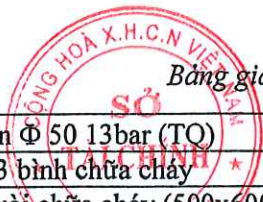
Bảng giá vật liệu xây dựng công bố tháng 4 năm 2021