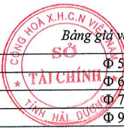
Bảng giá vật liệu xây dựng công bố tháng 4 năm 2021