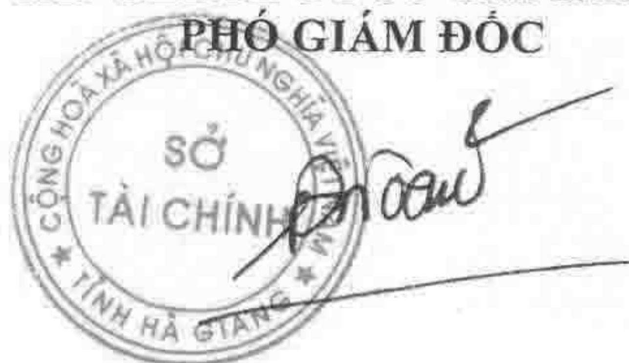
Đặng Quốc Toàn