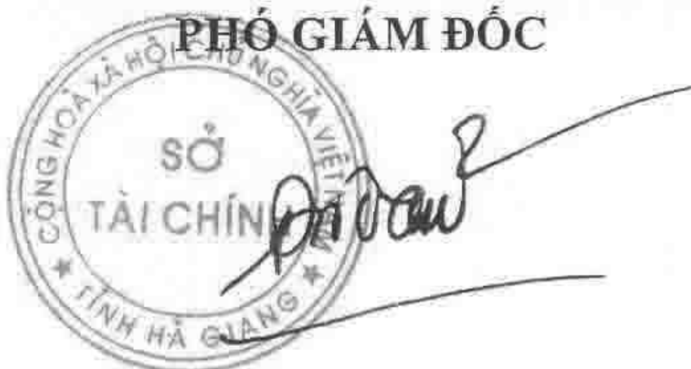
Đặng Quốc Toàn