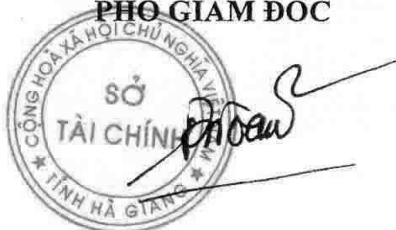
Đặng Quốc Toàn