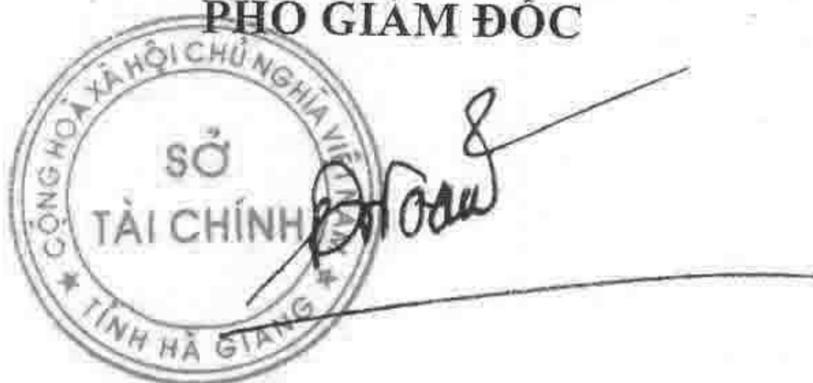
Đặng Quốc Toàn