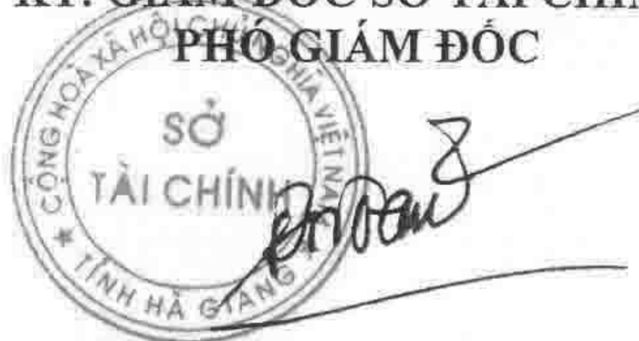
Đặng Quốc Toàn