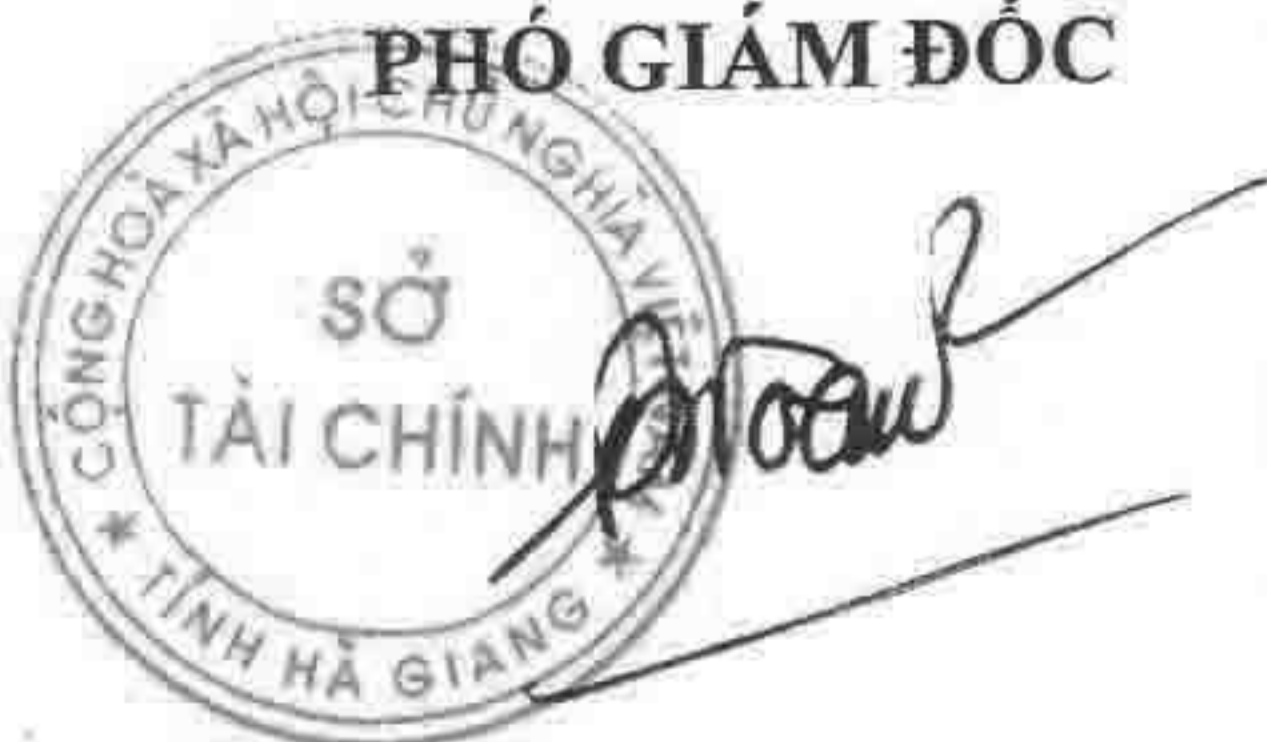
Đặng Quốc Toàn