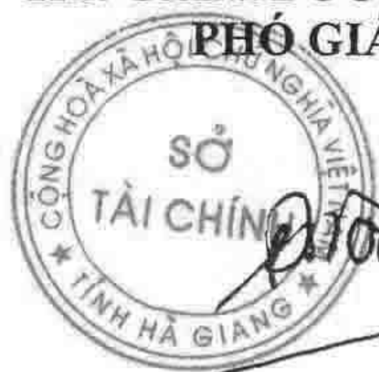
Đặng Quốc Toàn