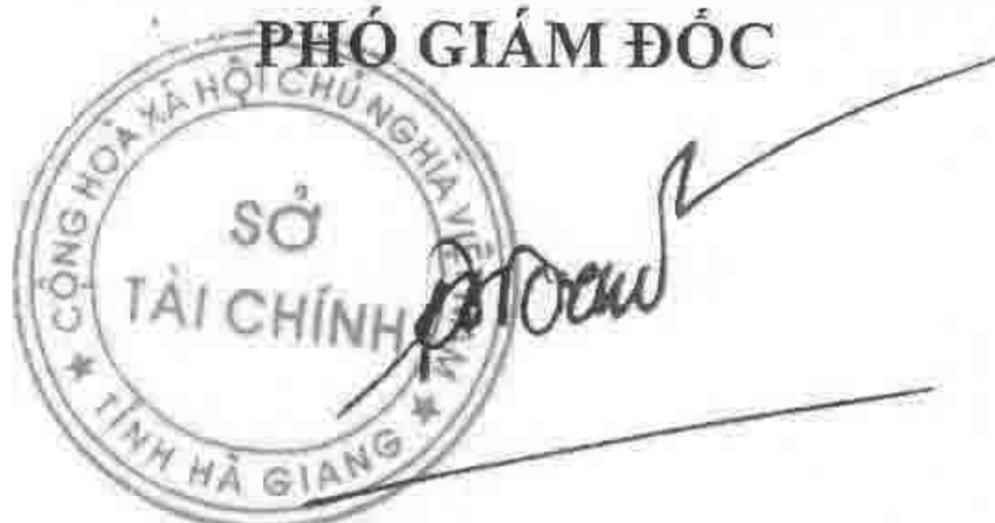
Đặng Quốc Toàn