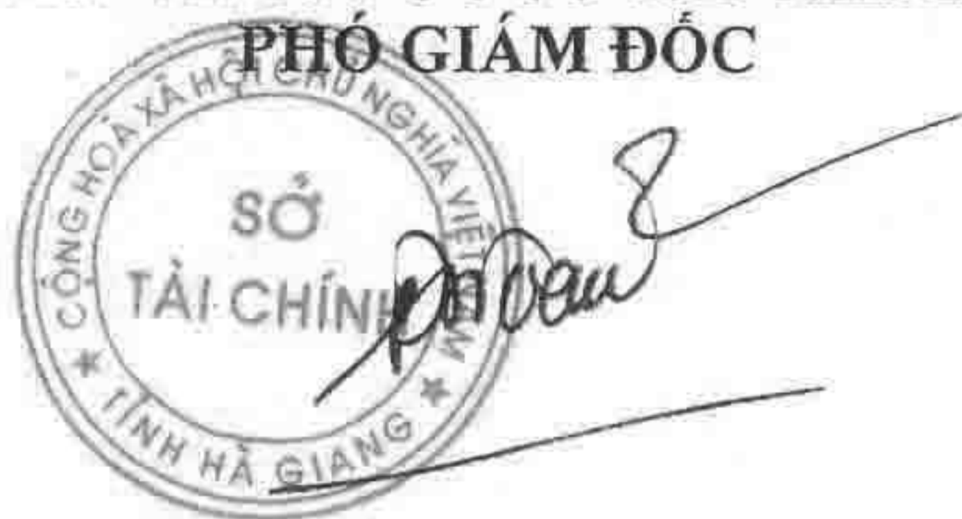
Đặng Quốc Toàn