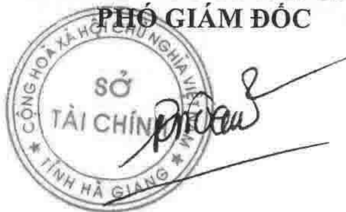
Đặng Quốc Toàn