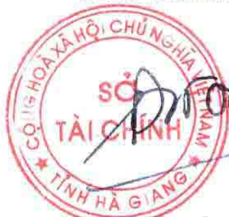
Đặng Quốc Toàn