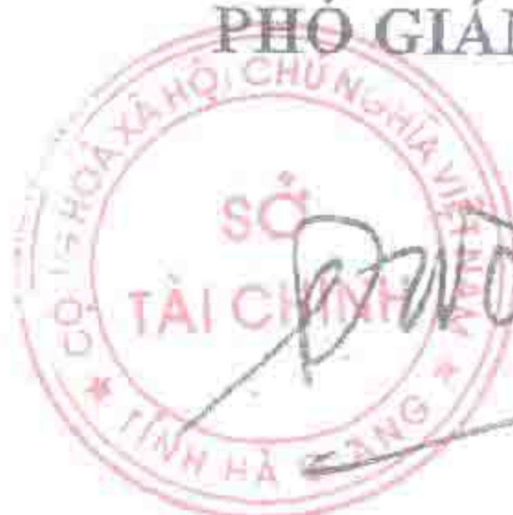
Đặng Quốc Toàn