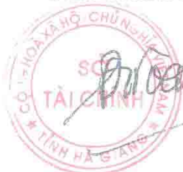
Đặng Quốc Toàn