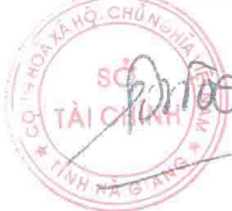
Đặng Quốc Toàn