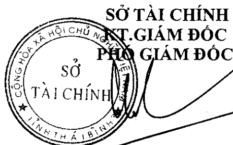
Phan Tự Long

2. Mức giá nêu tại điểm 1 Công bố này là cơ sở để Chủ đầu tư các công trình sử dụng vốn Nhà nước áp dụng và các công trình sử dụng nguồn vốn khác tham khảo để lập và quản lý chi phí đầu tư xây dựng công trình ./.